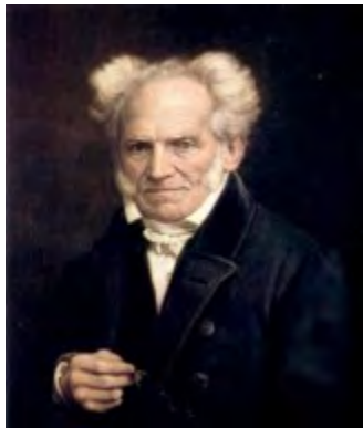
Portrait d'Arthur Schopenhauer, par Jules Luntenschütz.

De nos jours, il est courant de prétendre que le christianisme soit responsable de bon nombre de maux de ce monde, y compris celui de la misogynie (la haine et/ou les préjugés contre les femmes et les filles). En ligne avec cette revendication est la notion que la Bible est un livre profondément misogyne et que les chrétiens célèbres à partir de Tertullien jusqu'à C.S. Lewis avaient une considération médiocre des femmes. Bien que renforcées par la pratique dans certaines églises d'exclure les femmes du leadership, de telles réclamations sont en grande partie fausses (je peux entendre mon grand-père dire que les gens qui les prononcent « sont à court de couleurs de l'arc-en-ciel! »).