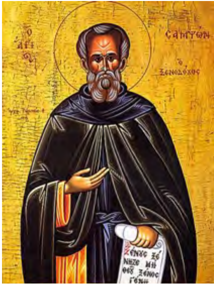
Saint Sampson le Révérend qui a construit certains des premiers hôpitaux dans l'Empire romain. (domaine public par l'intermédiaire)