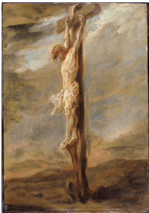
La crucifixion (d'après Rembrandt) Par Bonnat

en examinant son propre héritage spirituel, en rappelant sans doute les paroles du Psaume 8: « Qu'est-ce que l'humanité, pour que tu sois conscient d'elle, qu'est-ce que les êtres humains pour que tu te soucies d'eux ? (Psaumes 8:4).