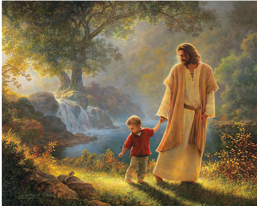
« Prends ma main » par Greg Olsen (Utilisé avec permission)

Cet article complète ce que nous avons couvert dans la partie 1 concernant l'union avec le Christ et l'humanité vicariante du Christ. Il examine ensuite le ministère du Saint-Esprit et le sujet connexe de la distinction biblique entre les croyants et les non-croyants. Tous ces sujets revêtent une grande importance pour la compréhension par CIG de la théologie trinitaire de l'incarnation.