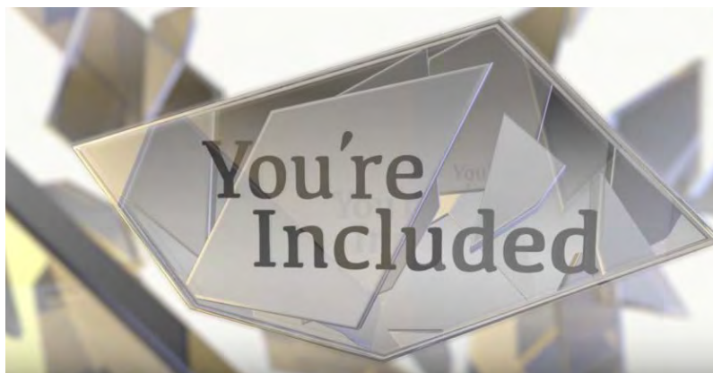
Logo de l'émission en ligne Vous êtes inclus .

Une compréhension clé de notre théologie concerne ce que Dieu a accompli pour toute l'humanité dans et à travers son Fils incarné, Jésus-Christ. Pendant de nombreuses années, nous avons résumé cette compréhension avec la phrase, tous sont inclus (et la déclaration qui l'accompagne, vous êtes inclus ). Nous entendons par « tous » les croyants et les non-croyants, et par « inclus » nous entendons être comptés parmi ceux que Dieu, dans et à travers Jésus, a réconciliés avec lui-même. Nous voulons donc dire que Dieu a réconcilié tous les êtres humains à lui .