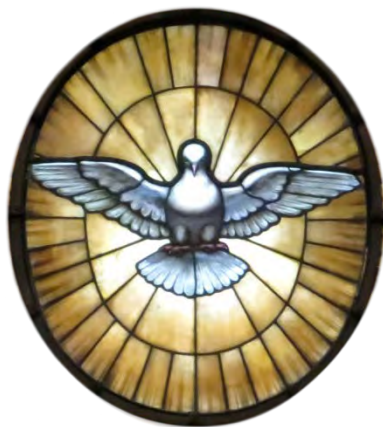
« La colombe du Saint-Esprit »

Un domaine où il est nécessaire de clarifier et d'ajuster les choses concerne ce que nous enseignons au sujet de la relation du Saint-Esprit et de notre participation (réponse) à tout ce que Jésus a accompli pour nous. Nous voyons maintenant que certains termes que nous avons employés pour décrire l'œuvre ( objective ) accomplie de Jésus et son ministère sont plus appropriés et directement applicables au ministère continu du Saint-Esprit et à notre participation ( subjective ) personnelle connexe. À cet égard, les termes (que nous voulons employer tel qu'ils sont utilisés dans l'Écriture) « union avec le Christ », « l'habitation » du Saint-Esprit et être des « membres du Corps du Christ » font tous référence à la réponse du croyant au don de la grâce de Dieu par l'action du Saint-Esprit. Ces termes font référence à la qualité de la relation qui naît de notre participation en tant que personnes (sujets) formées et transformées en conformité avec le Christ par le Saint-Esprit.