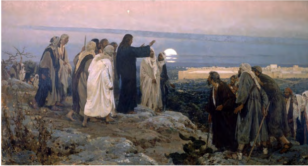
« Il pleura sur lui » par Simonet

Ce que Jésus a fait (et continue de faire) dans son humanité, il l'a fait (et le fait) pour nous, à notre place et en notre nom comme l'un de nous. Jésus a été baptisé pour nous, a vaincu la tentation, a prié, a obéi et a souffert pour nous. Il est mort pour nous, est ressuscité et est monté au ciel pour nous, revêtu en quelque sorte, de notre humanité. Voilà en quoi consiste l'humanité vicariante de Jésus. C'est une vérité puissante et conséquente: l'évangile en un mot. Cependant, cela ne nous parle pas de notre salut et de notre relation avec Dieu par le Christ et par le Saint-Esprit. Il y a plus à l'histoire et donc notre prédication et notre enseignement doivent raconter toute l'histoire, pas seulement une partie. Et les parties devraient s'accorder, comme elles le font dans la révélation biblique.