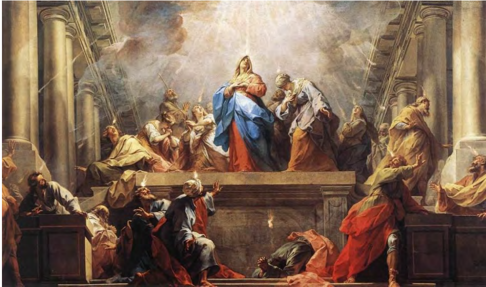
« La Pentecôte » par Restout

Dans la révélation biblique, l'union et la communion avec le Christ (l'union spirituelle) ne se trouvent pas principalement dans l'Incarnation, mais dans le ministère du Saint-Esprit. Cependant, cette union dépend, en effet, de l'œuvre achevée du Christ : sa vie, sa mort et sa résurrection et l'ascension comme celui qui est incarné, sur la base de son humanité vicariante. C'est pourquoi Jésus promet, puis envoie le Saint-Esprit — un événement glorieux que nous célébrons chaque année le dimanche de la Pentecôte.