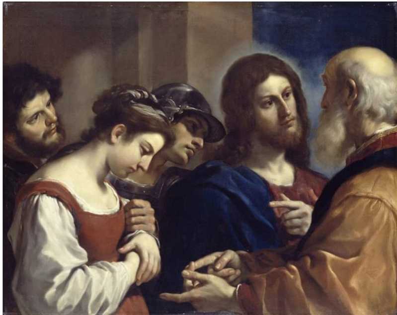
Jésus et la femme adultère

Jésus enseignait contre le péché. En s'adressant à une femme qui avait été prise en flagrant délit d'adultère, il a dit: « je ne te condamne pas; vas-y et désormais ne pèche plus » ( Jean 8:11 ). La déclaration de Jésus démontre son mépris du péché et transmet une grâce qui confronte le péché avec l'amour rédempteur. Ce serait une erreur tragique de considérer la volonté de Jésus de devenir notre Sauveur comme une tolérance du péché. Le Fils de Dieu est devenu l'un de nous, précisément parce qu'il était complètement intolérant à la puissance trompeuse et destructrice du péché. Au lieu d'accepter notre péché, il l'a pris sur lui, le soumettant au jugement de Dieu, pour être effacé par son offrande en notre nom.