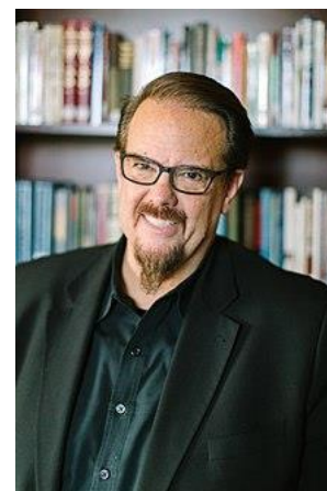
Dr. Ed Stetzer

CIG est d'accord avec ces énoncés, bien que nous les situerions dans le contexte théologique plus large de l'ensemble de notre Énoncé des Croyances. Notre accord se reflète par notre adhésion à la National Association of Evangelicals (aux États-Unis), à la World Evangelical Alliance, à l'Evangelical Alliance (au Royaume-Uni et aux Philippines) et à d'autres organisations similaires. Les croyances et les idéaux qui caractérisent ces organisations évangéliques sont abordés dans L'Engagement du Cap , un document de 80 pages résultant des délibérations de la Troisième Conférence de Lausanne sur l'Évangélisation mondiale . Si vous voulez en savoir plus sur ce que signifie être évangélique, je vous recommande fortement de lire ce document.