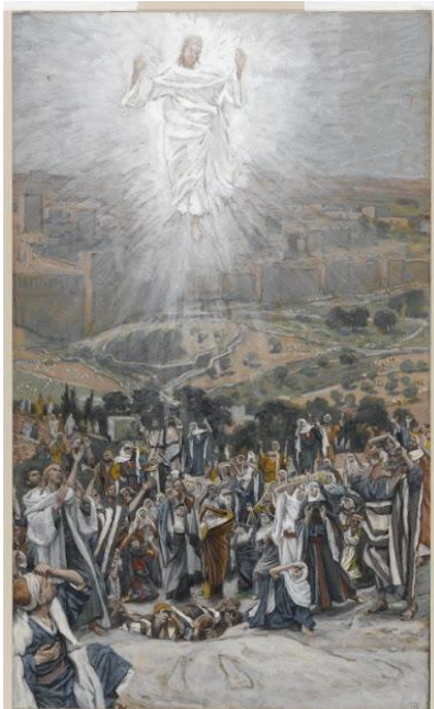
L'Ascension par Tissot