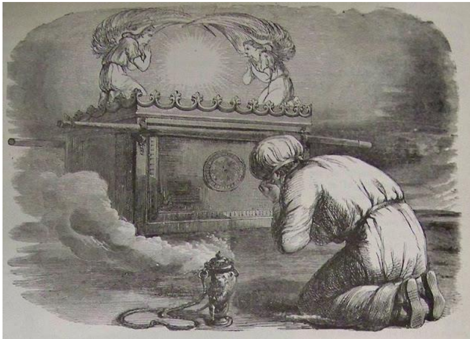
Le Grand Prêtre devant le propitiatoire par Holman

La vérité que Jésus, en sa propre Personne, est notre expiation avec Dieu était représentée dans le culte de l'ancien Israël sous l'Ancienne Alliance dans sa liturgie du Jour des Expiations. L'apogée de ce drame liturgique annuel était la présence physique du Grand Prêtre dans le Saint des saints. Là, représentant le peuple d'Israël (qui, à son tour, représentait toute l'humanité), le Grand Prêtre aspergeait le sang de l'animal sacrificiel sur le propitiatoire (grec = hilasterion ) placé au sommet de l'Arche de l'Alliance (voir Hébreux 9:5 , et Romains 3:25 ). Au sens ultime, le propitiatoire, en tant que lieu d'expiation, représentait Jésus lui-même (pour en savoir plus sur cette interprétation, cliquez ici pour Christ: Our Mercy Seat (Christ : notre propitiatoire) de Kyle Pope).