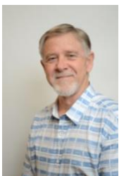
Par Randy Bloom

Seigneur, aide-nous à entendre ta voix. Aide-nous à la désirer ; garde nos oreilles attentives et suivons-la avec foi, espérance et courage, où qu'elle nous mène. Car nous savons que nous pouvons te faire confiance pour être avec nous à tout moment et en toutes choses. Amen.