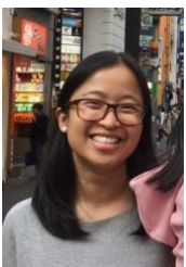
Par Joyce Tolentino Mandaluyong, Philippines

Prière: Merci Seigneur de ne pas être limité par nos défauts pour accomplir tes desseins. Crée en nous un cœur obéissant et compatissant pour proclamer l'Évangile et être l'expression de ton amour incessant envers ceux qui sont dans le besoin.