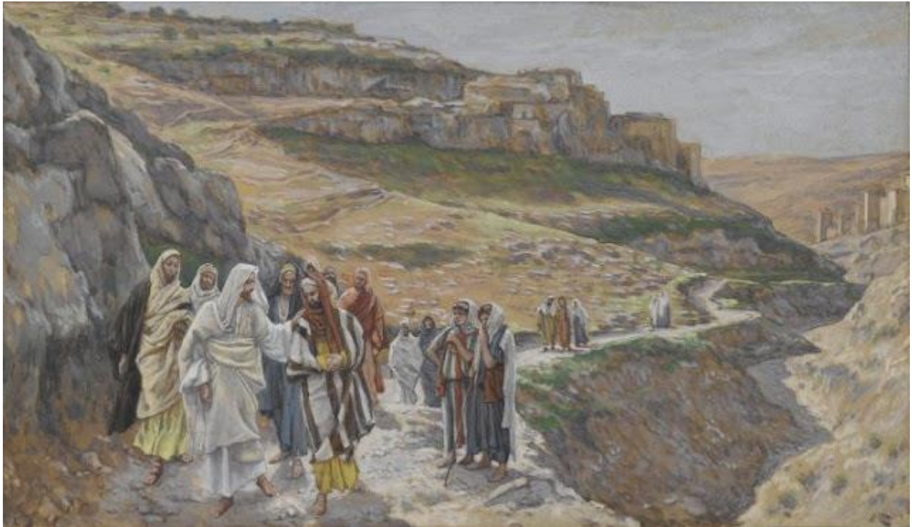
Jésus discute avec ses disciples par Tissot (domaine public via Wikimedia Commons)

Appartenir, croire, devenir (le cheminement avec Jésus)